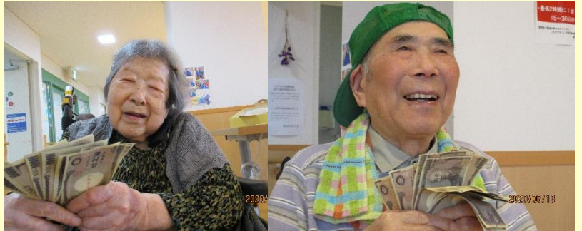
※写真のお金はレクリエーションで使用したおもちゃのお金です

等の入居者様の意見を頂きました。欲求があるのは元気の源と理解したのですが、「わたしゃあお金はもーえーよ」という回答には欲望の向こう側の境地におられる方なんだろうと思い、とちあえず拝んでみました。ある日のレクリエーションの一幕でした。