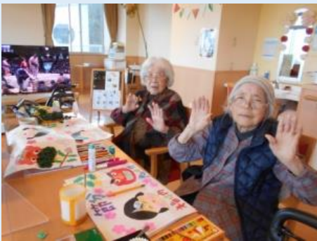
みごとに 入賞 しました！！