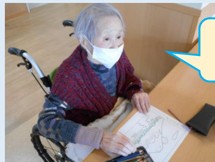
先生、 できましたよ♪