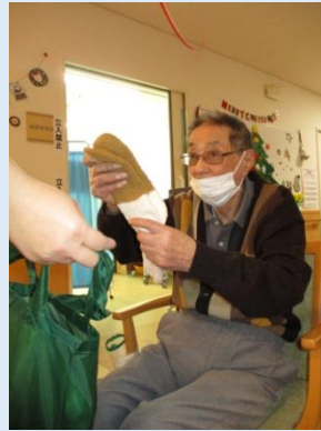
わたしはこれ選んだの〜よ♡