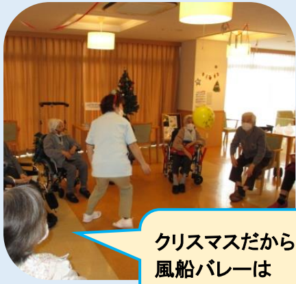
クリスマスだからこそ、 風船バレーは 楽しいんですよ♪